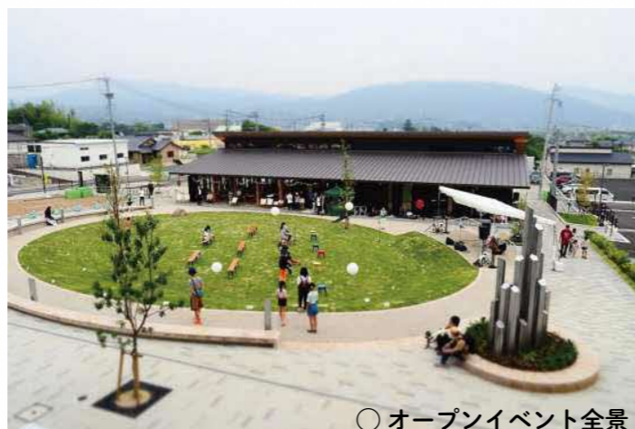
○ オープンイベント全景

また、このイベントの実現には多くの方々にご協力いただきました。運営に関わっていただいた皆さん、出演者の方々、地域の関係者の皆さんに心から感謝申し上げます。