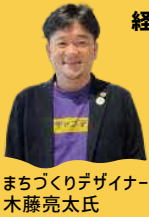
経験・知識豊かな講師陣

プロから話を聞ける&議論を深めるプログラムも準備しています。プログラム内では講師と積極的な交流も可能！自身の価値観を高めるチャンス！！