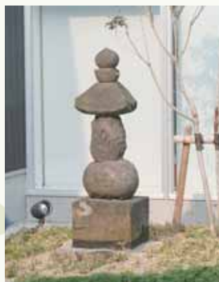
移築された五輪塔