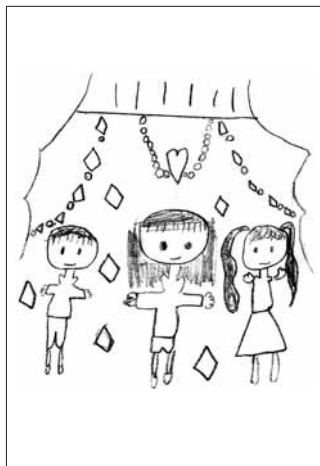
イラスト ありがとうございます！

✉ 近くのスーパーであるコストコフェア毎回楽しみに しています。ピザやケーキなどとてもおいしくて大 好きです。 P.N ツナマヨ