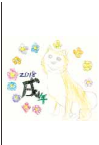
イラスト ありがとうございます！