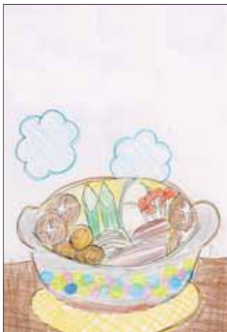
イラスト ありがとうございます！