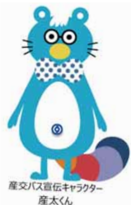
産交バス宣伝キャラクター 産たくん