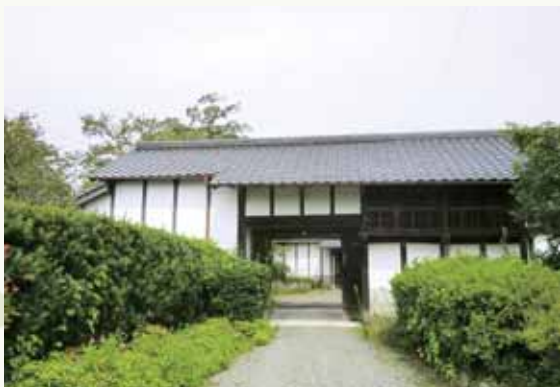
解体前の西園寺家の門