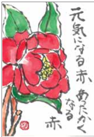
イラスト ありがとうございます！