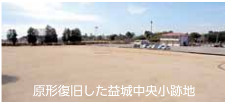
原形復旧した益城中央小跡地

損壊家屋等の解体および撤去については、すべて完了しました（【表1】参照）。それに伴い、災害ごみの一次仮置き場として使用していた益城中央小学校跡地を昨年10月末で閉鎖しました。原形復旧も終了し、今年2月からスポーツや健康づくりの場としてグラウンドなどの貸し出しを再開しています。