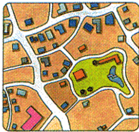
区画整理をする前