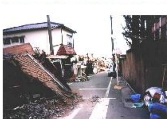
被災地の様子（阪神大震災）