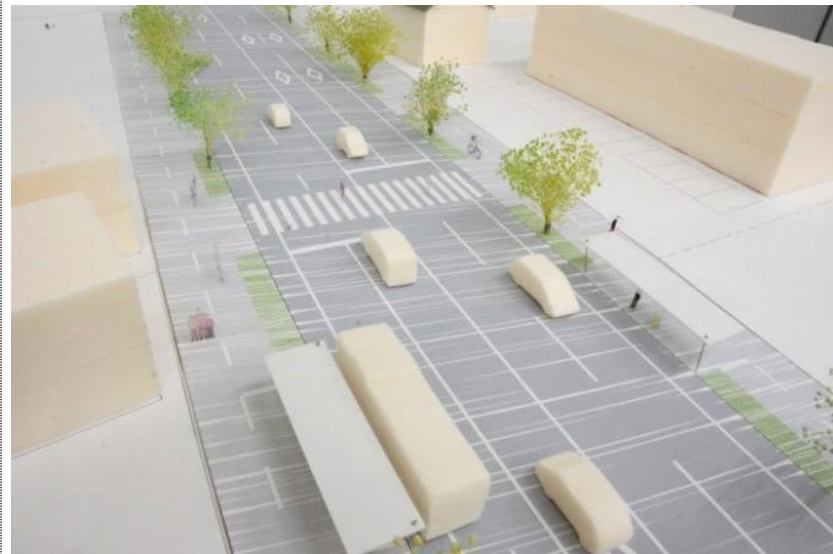
ケース1：一般的な道路