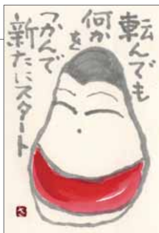
イラスト ありがとうございます！