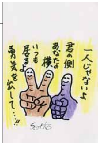
イラスト ありがとうございます！