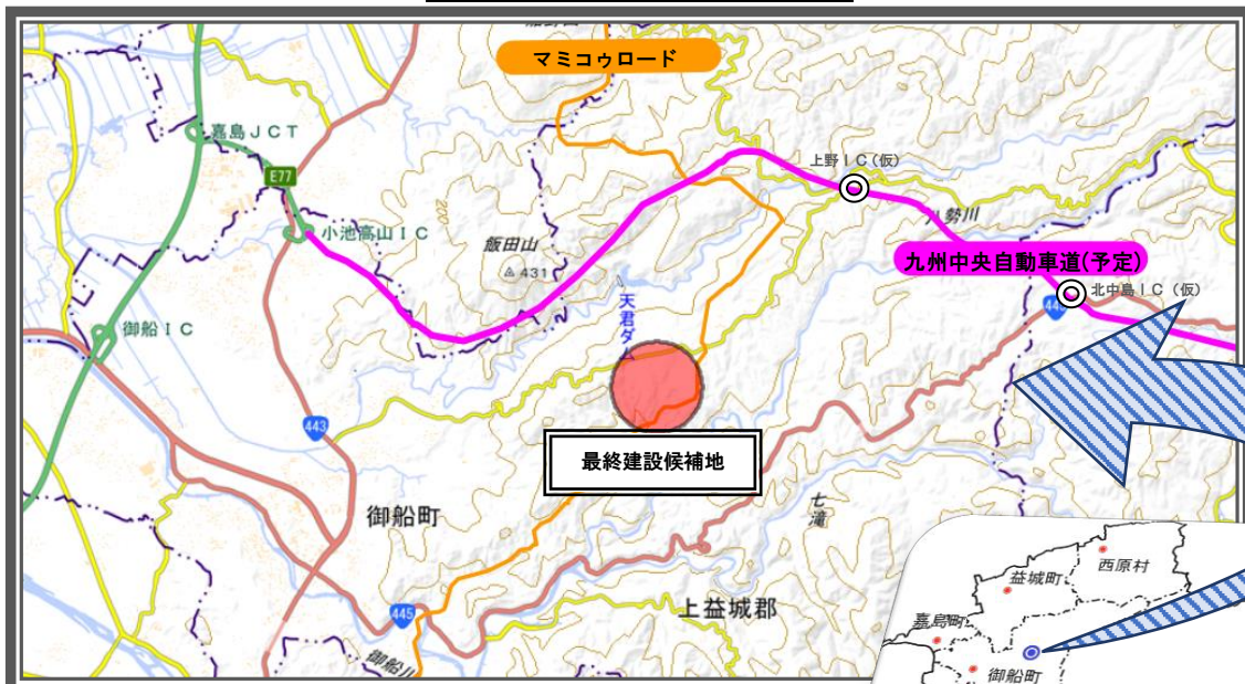
最終建設候補地位置概略図

なお、目標では新たなごみ処理施設の稼働時期を平成37年度としていますが、熊本地震や、その後の大雨等の自然災害によって各町村の財政状況は想定以上に厳しくなっているため、建設工事への着手時期については、各町村の財政状況を勘案しながら検討してまいります。（6月7日 現在）