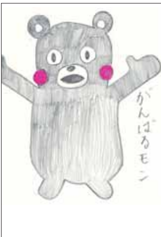
イラスト ありがとうございます！