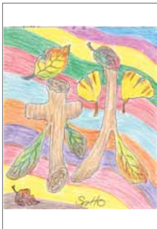
イラスト ありがとうございます！