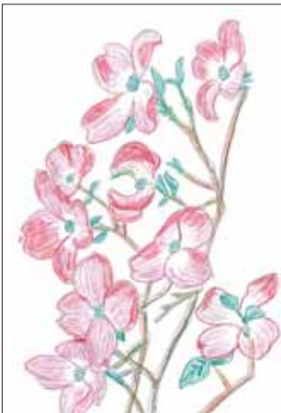
イラスト ありがとうございます！