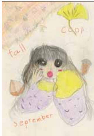
イラスト ありがとうございます！