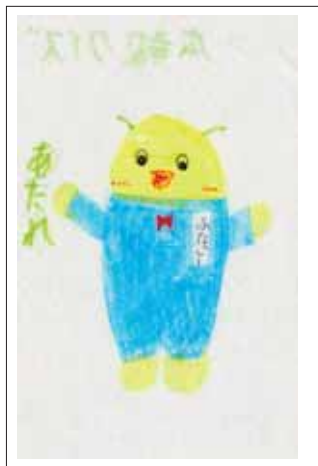
イラスト ありがとうございます!