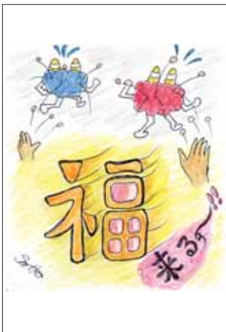
イラスト ありがとうございます！