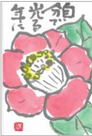
イラスト ありがとうございます！