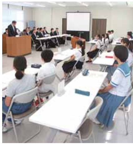
答弁に真剣に聞き入る子ども議員たち

また、杉堂、堂園および谷川の3つの断層を活用した教育旅行や、サンジ像の活用により、子どもたちにも来てもらえるようなまちづくりをしていきたいと考えています。