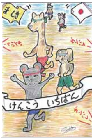
イラスト ありがとうございます！