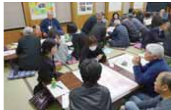
完成した防災マップ表面(左)/ 真剣に取り組んだ勉強会(上)