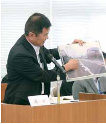
写真を使つての執行部の丁寧な説明

です。町では、現状の狭い歩道では歩行者が危険であると、以前から道路管理者である県に歩道整備の要望を行つてきました。しかし、県としては、予算の都合もあり、事業の実施には至りませんでした。それでも町から県に要望を続け、ようやく平成30年度に歩道整備の事業として採択されることになりました。