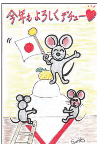
イラスト ありがとうございます！