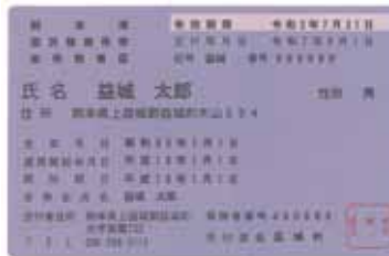
国民健康保険証(紫色)