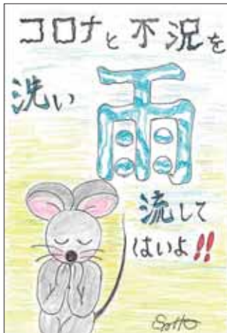
イラスト ありがとうございます！