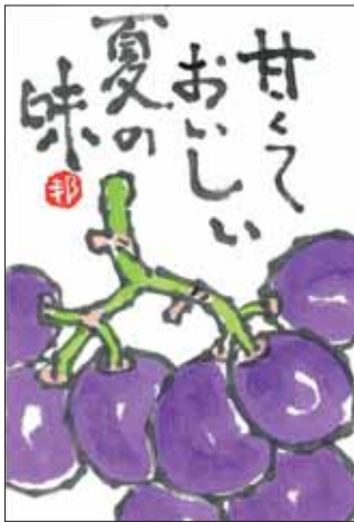
イラスト ありがとうございます！