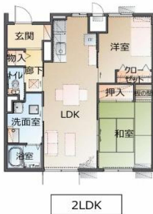
間取りイメージ図 (2LDK)