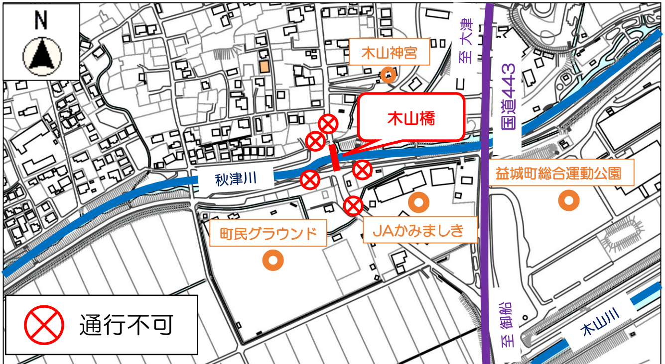
木山橋架け替え工程表（予定）