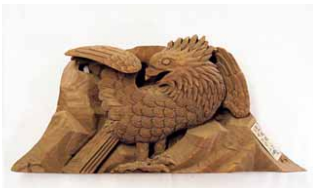
木山神宮にも見られる鷹の彫刻