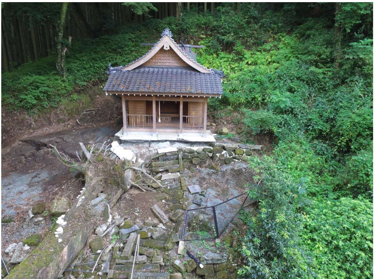
図 2-1-4 杉堂地区・潮井神社 空中写真-4