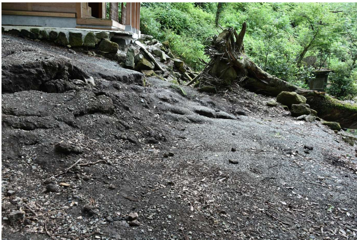
図 2-1-14 杉堂地区・潮井神社(地表地震断層) 空中写真-14