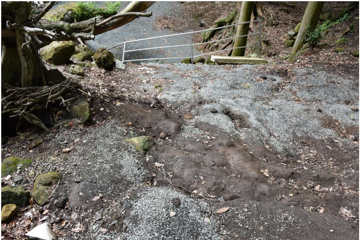
図 2-1-12 杉堂地区・潮井神社(地表地震断層) 空中写真-12