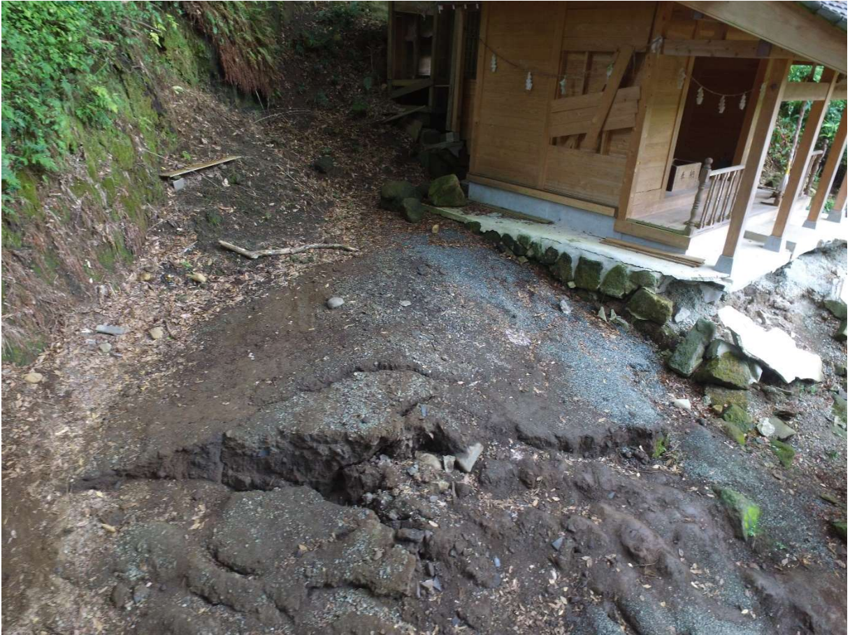
図 2-1-5 杉堂地区・潮井神社(地表地震断層) 空中写真-5