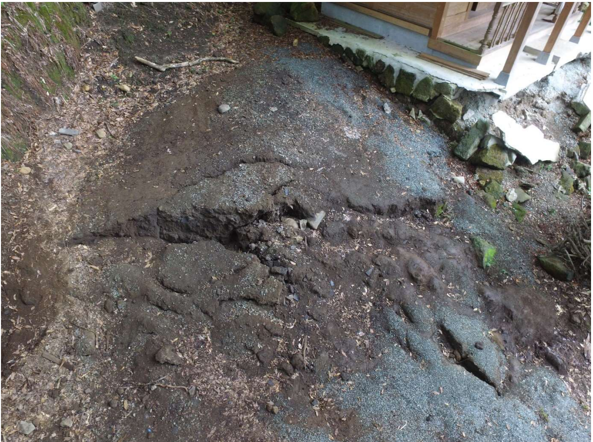
図 2-1-6 杉堂地区・潮井神社(地表地震断層) 空中写真-6