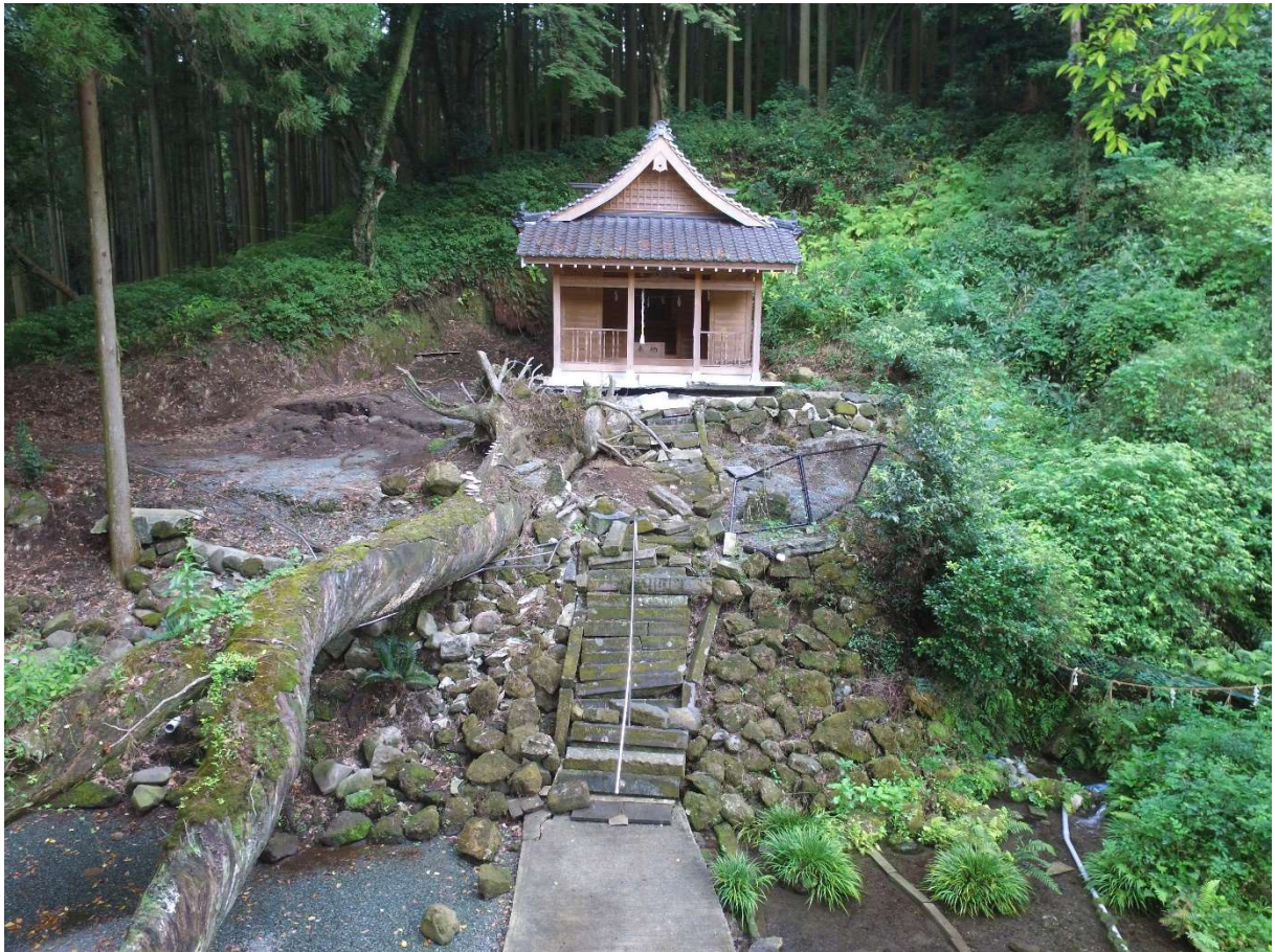
図 2-1-3 杉堂地区・潮井神社 空中写真-3