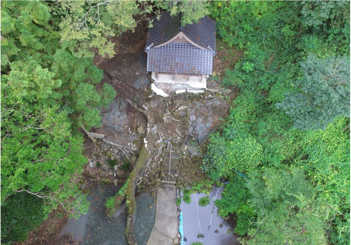
図 2-1-1 杉堂地区・潮井神社 空中写真-1