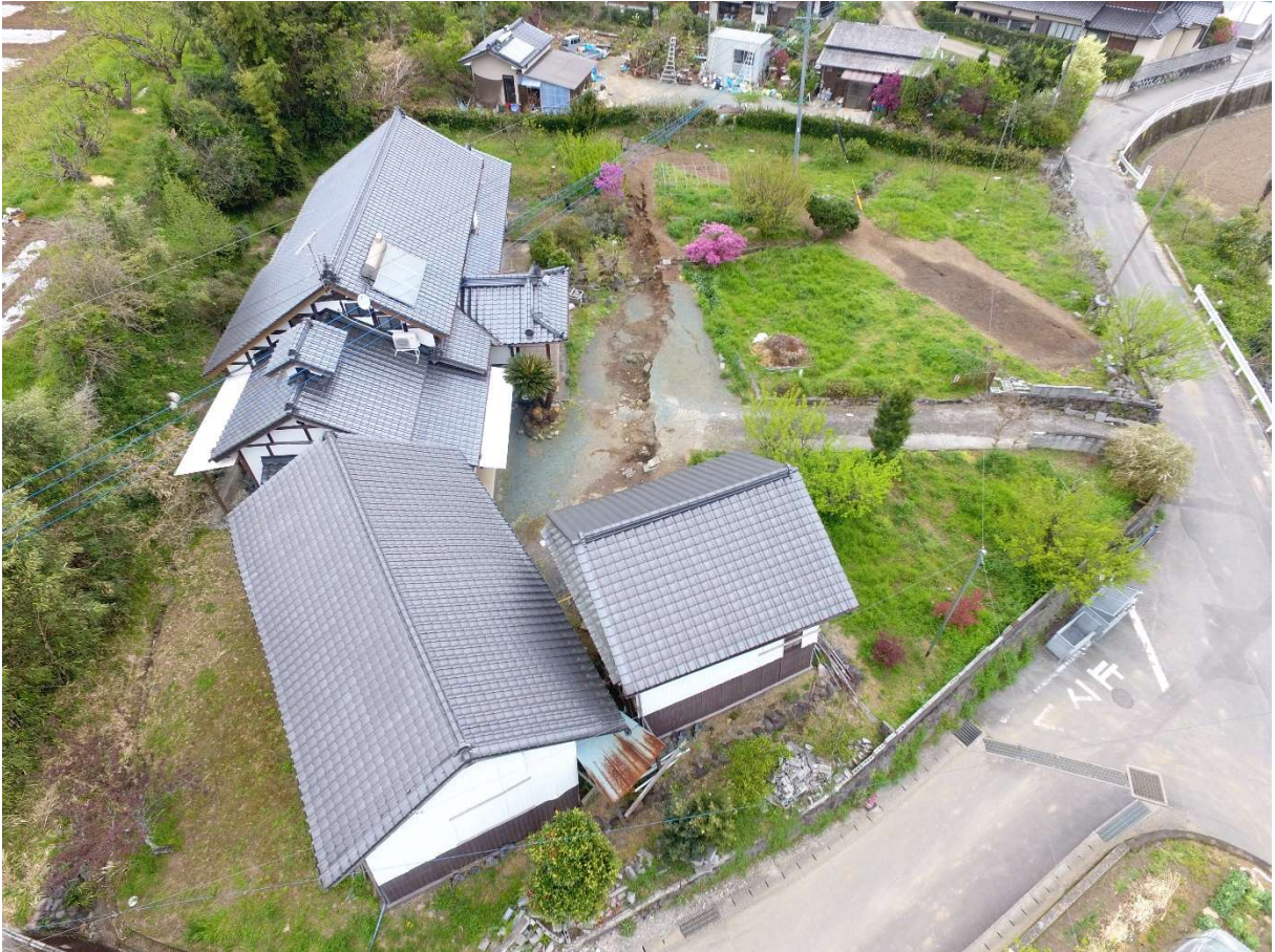
図 2-2-4 谷川地区 空中写真-4