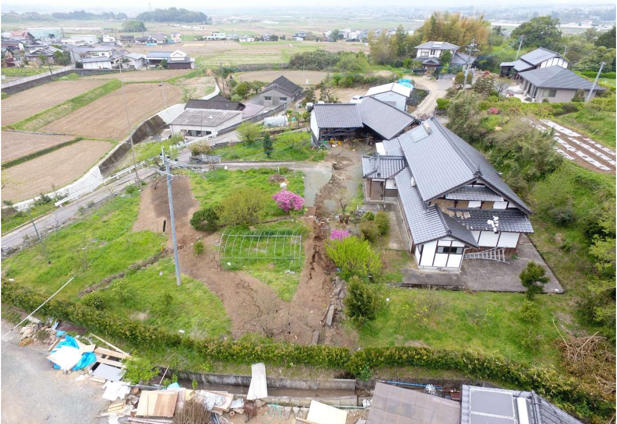
図 2-2-3 谷川地区 空中写真-3