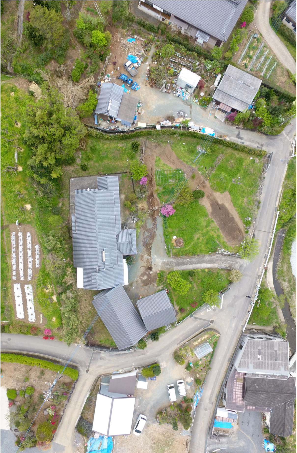
図 2-2-1 谷川地区 空中写真-1