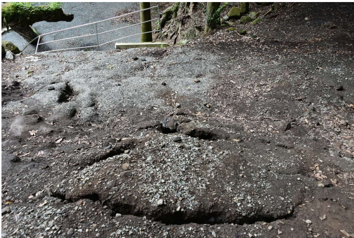
図 2-1-13 杉堂地区・潮井神社(地表地震断層) 空中写真-13