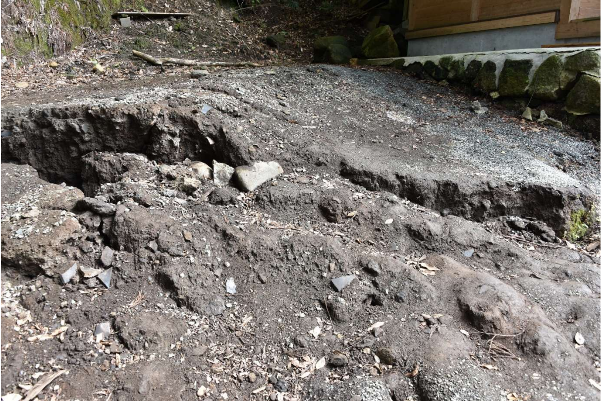
図 2-1-9 杉堂地区・潮井神社(地表地震断層) 空中写真-9