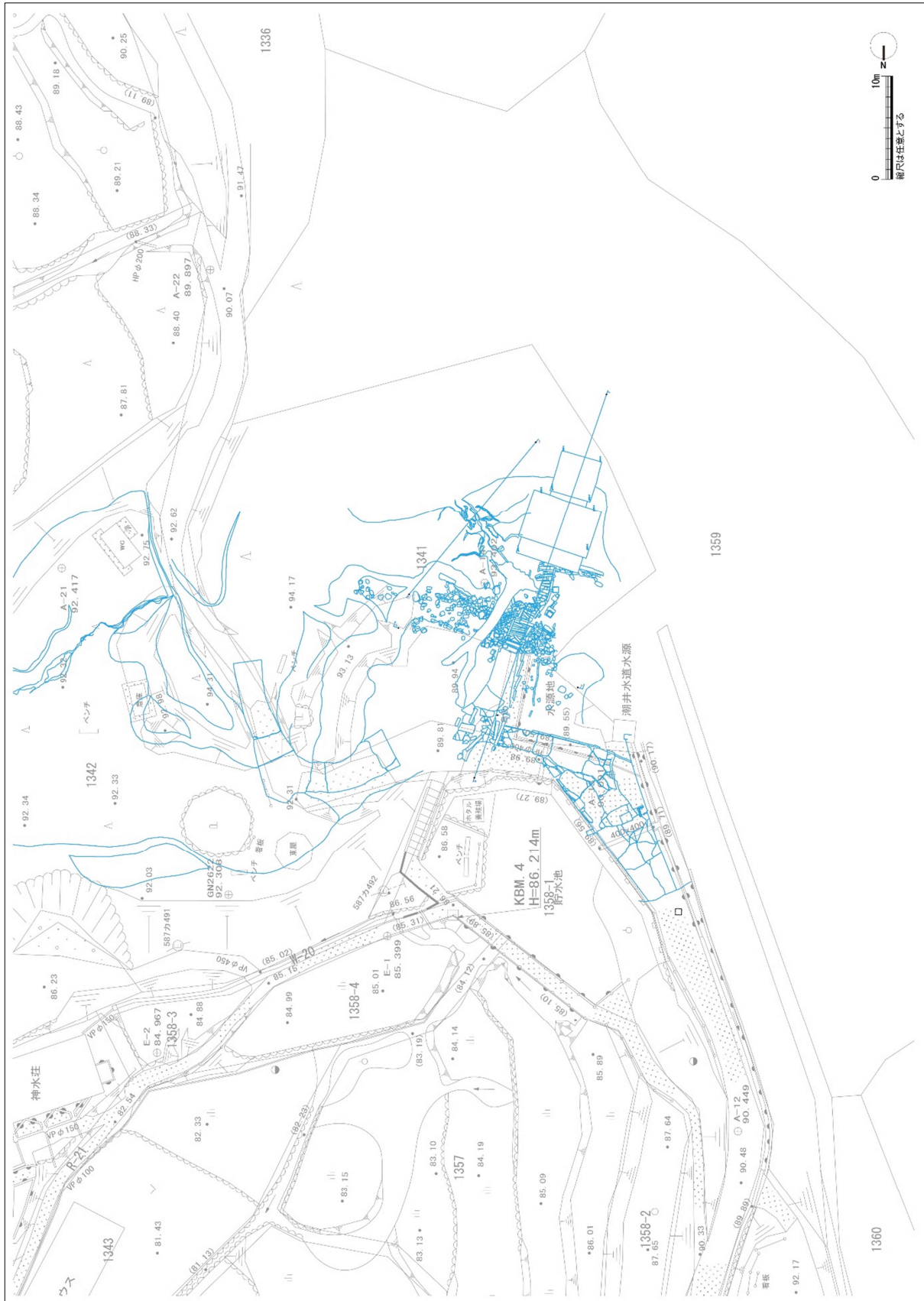
図 3 杉堂地区地震前後重ね平面図

平成 23 年度潮井公園基本計画修正業務委託の測量成果に、平成 29 年度 3 次元計測データ(青線)を重ねた。