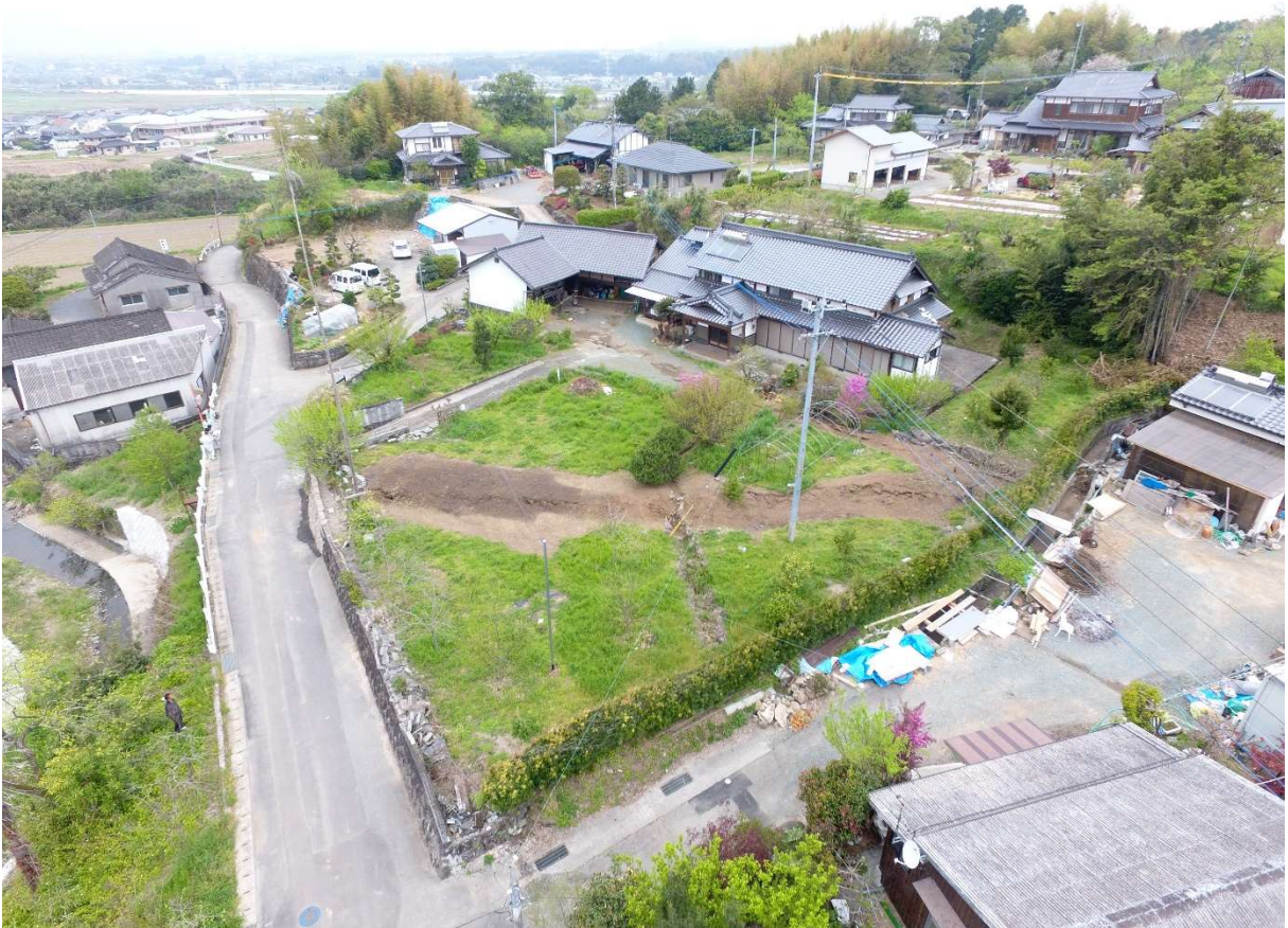
図 2-2-2 谷川地区 空中写真-2