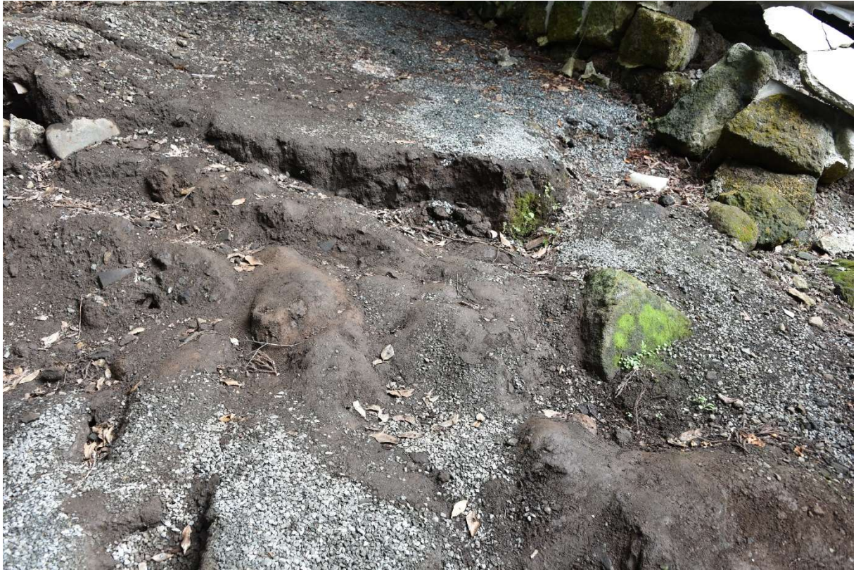
図 2-1-11 杉堂地区・潮井神社(地表地震断層) 空中写真-11