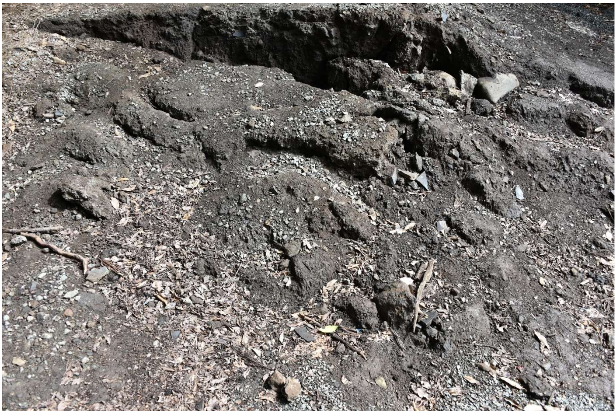
図 2-1-8 杉堂地区・潮井神社(地表地震断層) 空中写真-8