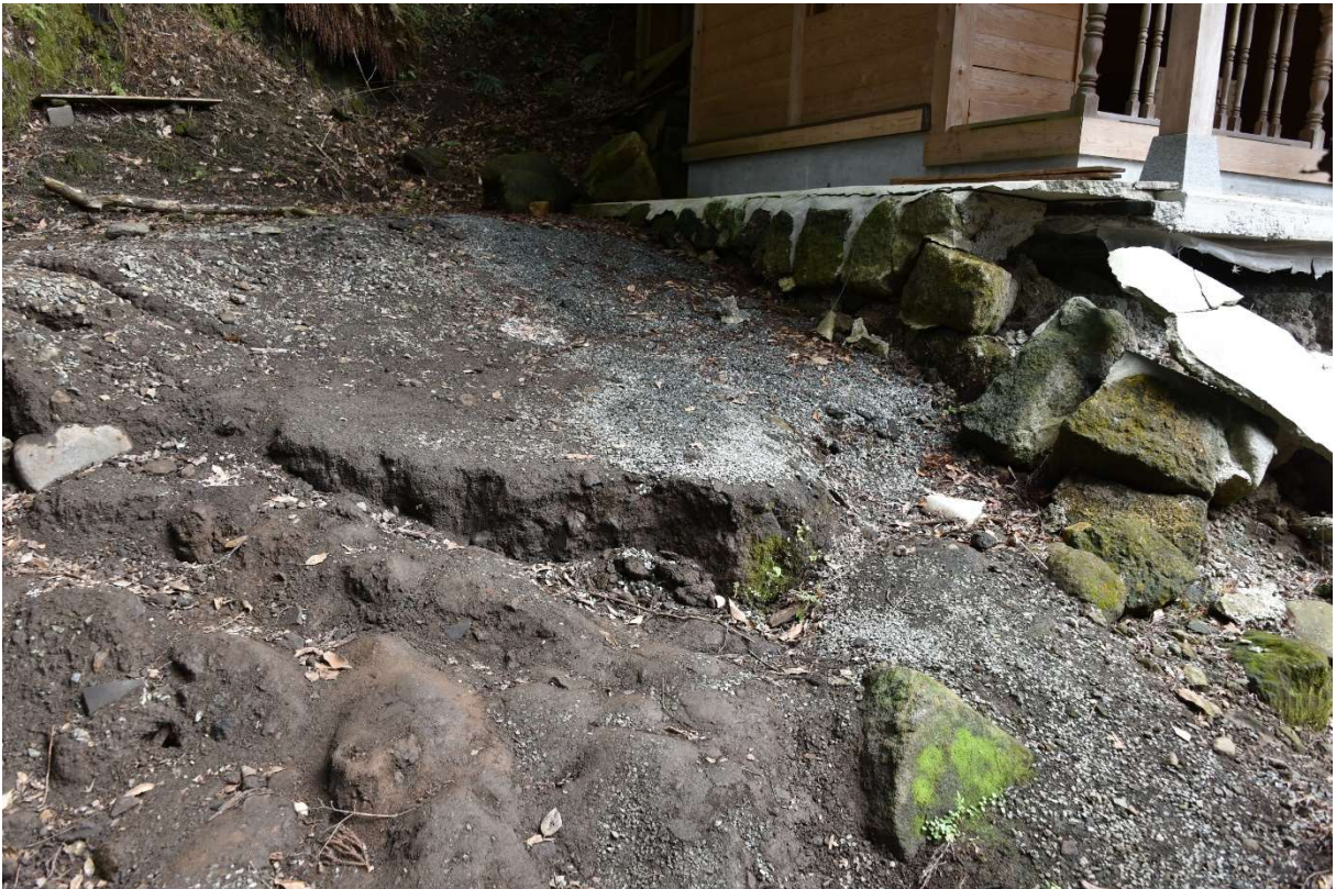
図 2-1-10 杉堂地区・潮井神社(地表地震断層) 空中写真-10