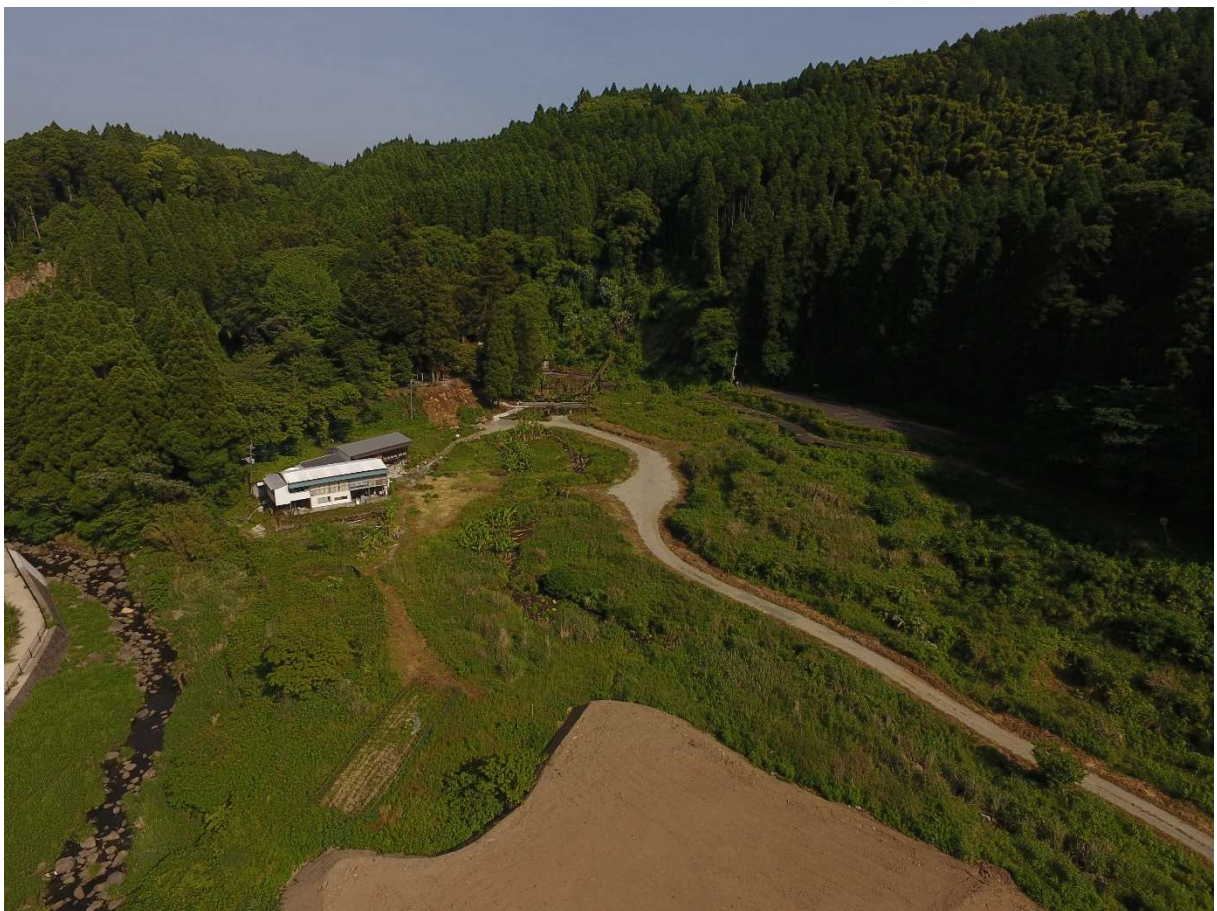
図 2-1-16 杉堂地区 空中写真-16