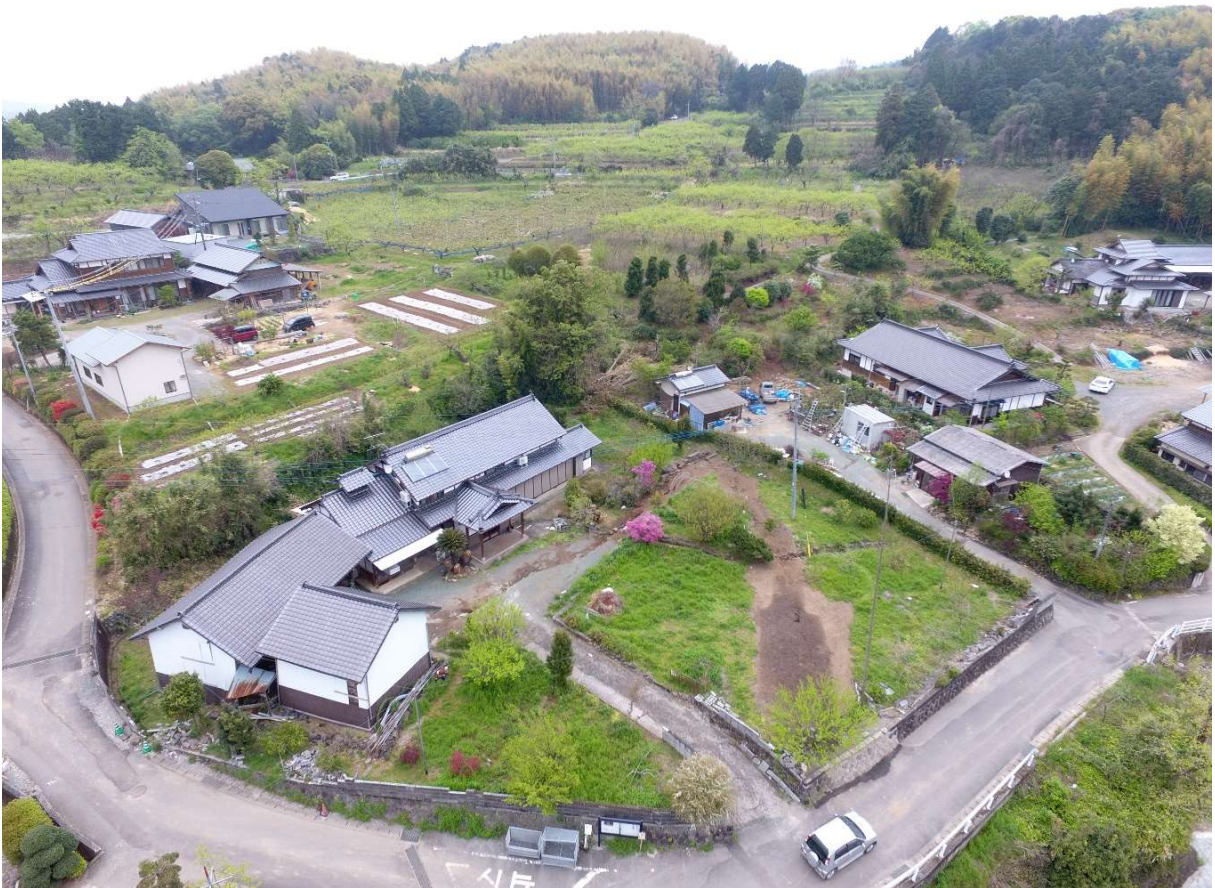
図 2-2-5 谷川地区 空中写真-5