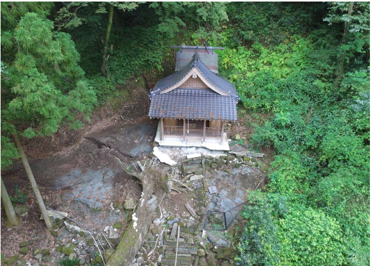
図 2-1-2 杉堂地区・潮井神社 空中写真-2