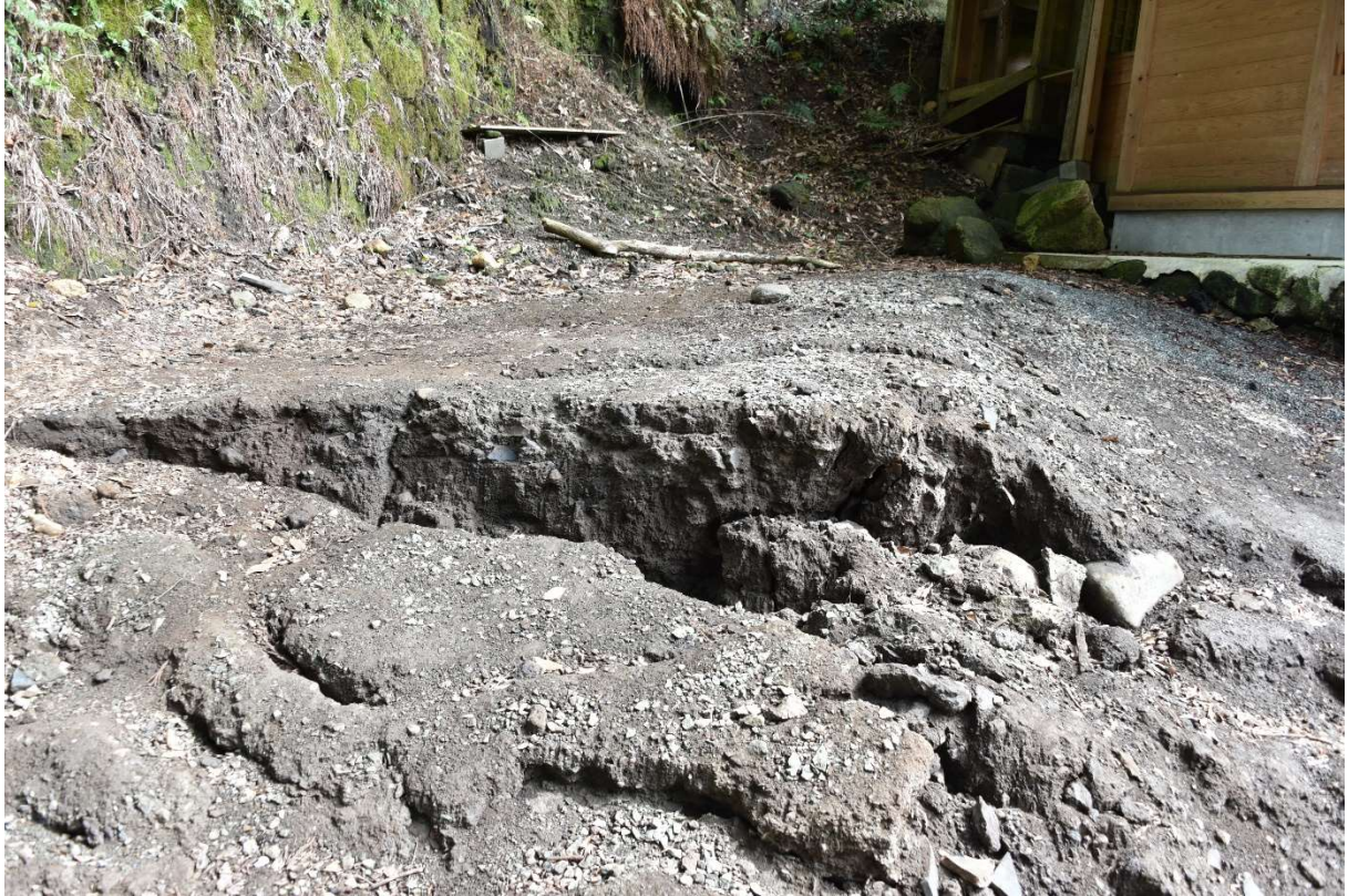
図 2-1-7 杉堂地区・潮井神社(地表地震断層) 空中写真-7