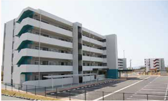
災害公営住宅（下辻団地）