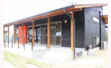
みんなの家の利活用 （田中地区公民館）