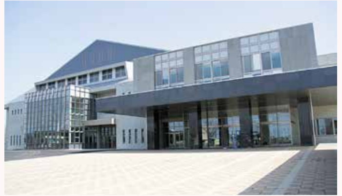
益城町総合体育館メインアリーナ