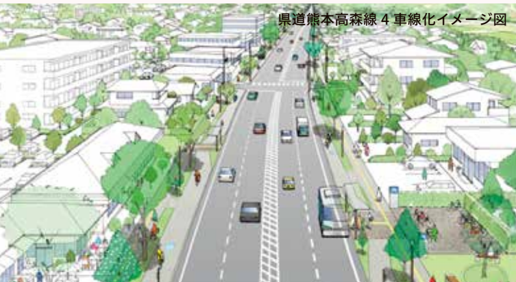
県道熊本高森線 4 車線化イメージ図