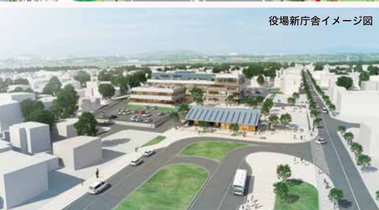
役場新庁舎イメージ図