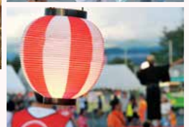
町民が主体となった にぎわいづくりの 動きも徐々に