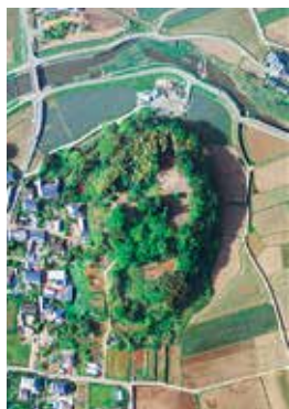
(左) 赤井城跡の図面 (右) 現在の赤井城跡