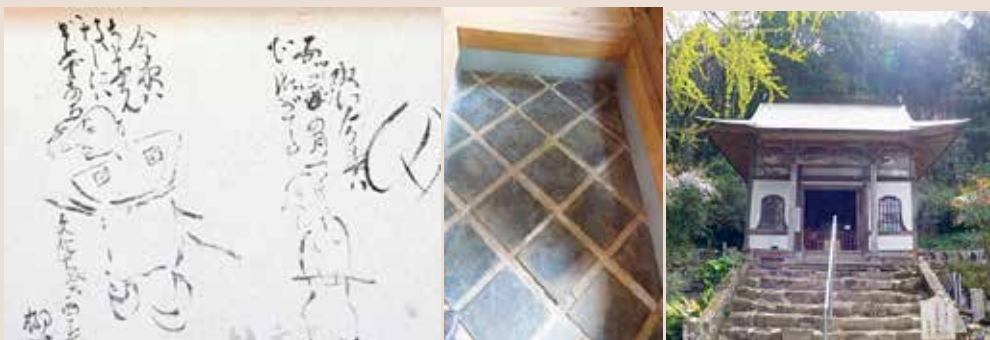
(左から) 発見された壁の落書き、瓦敷の土間、修復工事が行われた本堂(観音堂)

多数見つかり、そのころ本堂がここに存在したことを証明する貴重な資料になりました。江戸時代にも落書きをする人がいたようです。このように幅広い層によって残された貴重な落書きは、現在、見ることではできませんが、上から新しい壁を設けて保存されています。 益城町文化財保護委員会