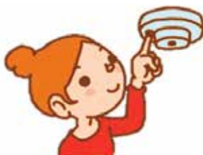
【令和3年町内の火災等発生状況】

本体のボタンを押すか、ひもを引いて、音が正常に作動するか確認 音がしない場合は、電池切れや故障の可能性あります。