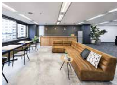
▲おしゃれな造りの東京オフィス内観

③(社員談)熊本県出身の社長が一番の自慢です。社長はおしゃべりで、いつまでたっても熊本弁。そして弱冠26歳。社員の平均年齢も28歳です。熊本県出身の社員も多く、東京オフィスでも「熊本の会社？」と思われるほど。とにかく目立ちたがりな人ばかりで、明るい会社です。益城町ではかなり浮いた存在になりそうなので、気をつけます！