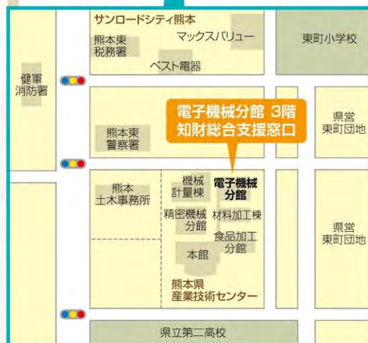
◎知財総合支援窓口は熊本県産業技術センター電子機械分館3階です。