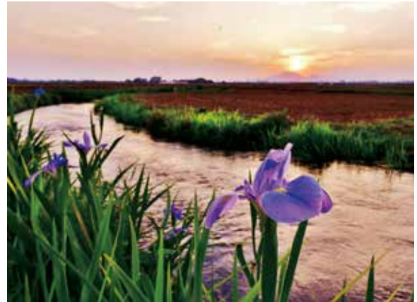
『藻川の夕陽』 山来敬明さん 撮影場所：赤井