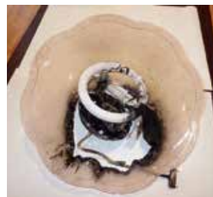
コンデンサーから出火した照明器具