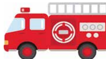
【令和 4 年町内の火災等発生状況】