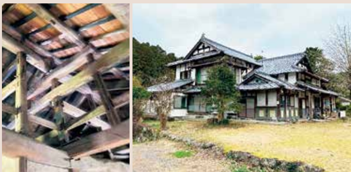
㊤土間から見上げた屋根を支える小屋組み ㊦河端新家住宅外観

開館 … 火・木～日曜日 午前10時～午後6時 水曜日 午後0時～8時 休館 … 月曜日(祝日の場合は翌日)、毎月第3金曜日