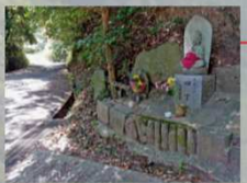
四丁地藏 車道と出会います