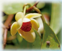
ピナンカズラ(別名サネカズラ)