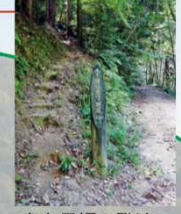
急な男坂の登り口