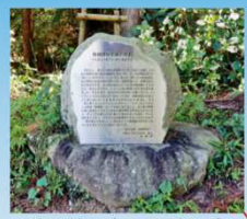
池の前に立つ民話の碑

白山権現神社の横の小池は、民話飯田山と金峰山の背比べの時に水が流れ落ちて出来た名残だと言われています