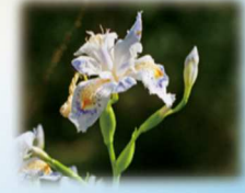
シャガ(アヤメ科) 花期:4月~5月