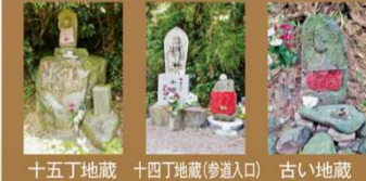
十五丁地藏 十四丁地藏(参道入口) 古い地藏

江戸時代後期、嘉島町のサントリー工場の横の花立から飯田山・常楽寺の山門までの参道に、一丁(約109m)毎に37体の仏様が置かれました。常楽寺にお参りする人の安全を見守ってくれていたのでしょう。平成になって、登山道入口の十四丁から新たに平成の一丁地藏が作られました。その間に古い仏様も並んで立っています。