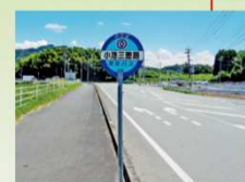
小池三叉路バス停