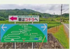
車道と歩道の分岐点