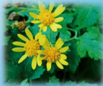
シマカンギク(キク科) 花期:10~12月 香が強い小さい菊の花