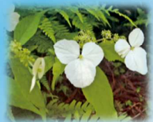
コガクツギ(ユキノシタ科) 花期:5月