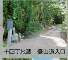
十四丁地藏 登山道入口