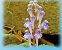
コバンツツナミソウ(シソ科) 花期:4月