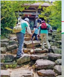
自然石を積んだ石段