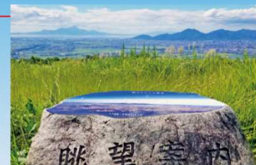
頂上からは熊本平野を一望出来、金峰山、海の向こうには雲仙の山々も見えます