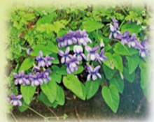
コスミレ(スミレ科) 花期:3月