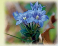
フデリンドウ(リンドウ科) 花期:4月