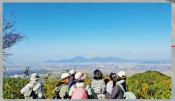
熊本平野を見渡す展望スポット