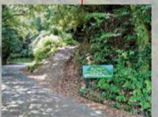
よめご坂、急な坂の登り口