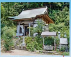
常楽寺本堂 (観音堂)