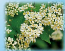
マルバクツギ(アジサイ科) 花期:4月~5月