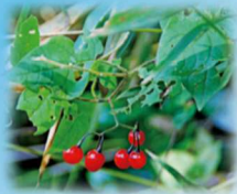
ヒヨドリジヨウゴ 実の時期:11月