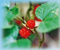
フユイチゴ(バラ科) 実の時期:10月~