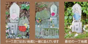
一丁地藏さん (仏様)

江戸時代後期、嘉島町のサントリー工場の横の花立から飯田山・常楽寺の山門までの参道に、一丁(約109m)毎に37体の仏様が置かれました。常楽寺にお参りする人の安全を見守ってくれていたのでしょう。平成になって、登山道入口の十四丁から新たに平成の一丁地藏が作られました。その間に古い仏様も並んで立っています。