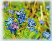
ホタルカズラ(ムラサキ科) 花期:4月