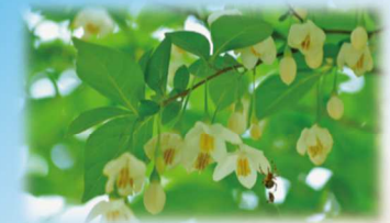
エゴノキ(エゴノキ科) 花期:4~5月