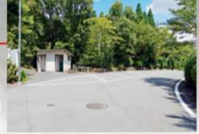
登山道前の駐車場 5,6台駐車可・トイレも有