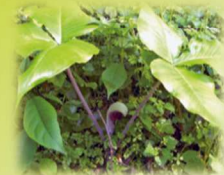
ムシアブミ(サトイモ科) 花期:3~5月