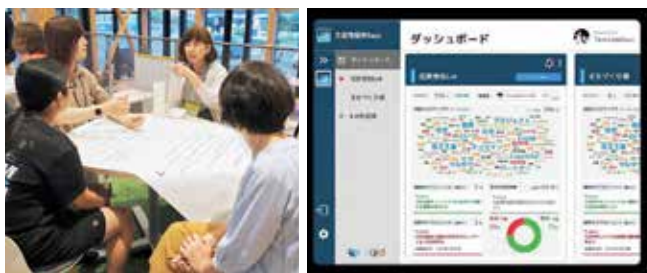
これまでの未来カフェ 公開型意見募集ツール「Liqlid」

日時 3月26日(火)午後5時30分～7時30分 場所 復興まちづくりセンターにじいろ 主催 ましき未来カフェ実行委員会 申し込み 定員 先着30人 フォーム 申し込み 3月22日(金)までに 申し込みフォームから