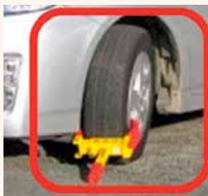
問 役場税務課 債権管理係 286-3116

の開催です。グランメッセ熊本本の空に、のびのび泳ぐ数百匹のこいのぼりの姿は圧巻！ 芝生に座って間近で大型こいのぼりを一堂に見ることができまので、ぜひ家族皆さんでお越しください。 期間：4月19日(金)～5月12日(日) 場所：グランメッセ熊本 芝生広場一帯 家庭で眠っているこいのぼりの寄贈募集中！ こいのぼりの状態が許す限り、令和7年以降、毎年グランメッセ熊本に飾ります。寄贈は持参か郵送で左記へ。 問 グランメッセ熊本 286・8000 住 福富1010