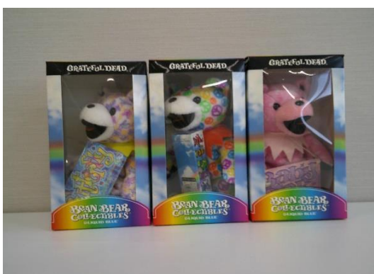
売却区分番号 2 3 ~ 2 5