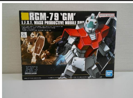
売却区分番号 2 0