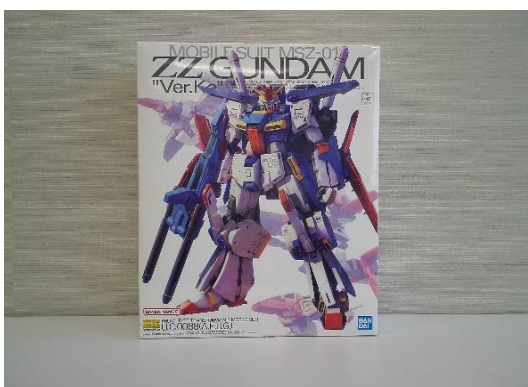
売却区分番号 2 1