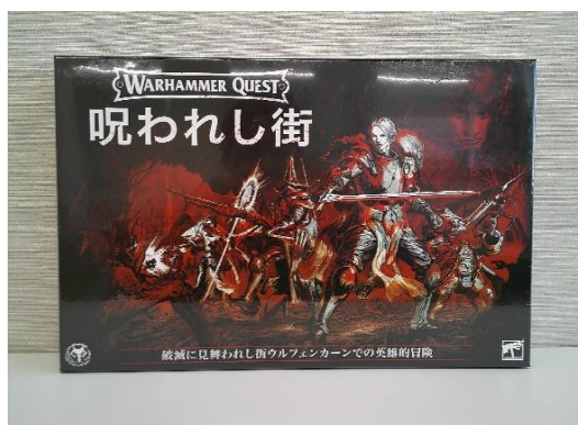
売却区分番号 2 2