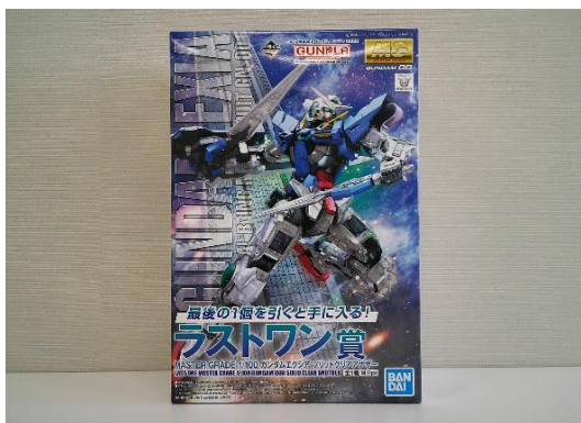
売却区分番号 1 7