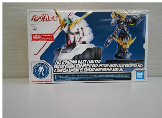
売却区分番号 1 8