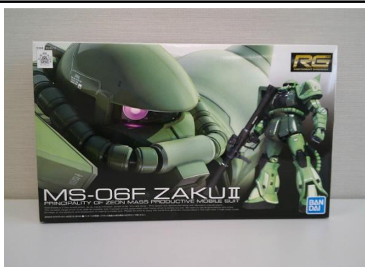
売却区分番号 1 9