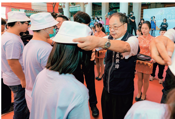
台中市で行われた成人礼。「3つの贈り物」として、去年は「リュックサック、帽子、Tシャツ」が贈られた。

益城町の友好交流都市である「台湾台中市大甲区」を中心に、台湾の暮らしや文化、習慣など、台湾の今をお届けします。