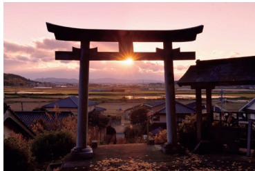
『霜宮神社の夕照』 山来敬明さん 撮影場所：上陳