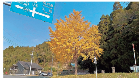
『分岐点の銀杏』 眞田昇さん 撮影場所：津森郵便局横