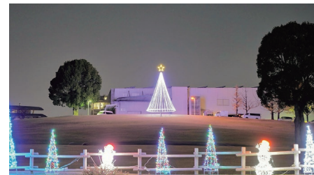
『再春館ヒルトップのイルミネーション』 福島ショウタさん 撮影場所：寺中

投稿は①氏名 ②住所 ③撮影場所 ④作品名を明記し mashikiphoto@gmail.com へ送信してください