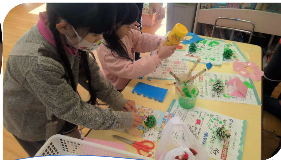
自分なりに工夫して、まつぼっくりのクリスマスツリー作り