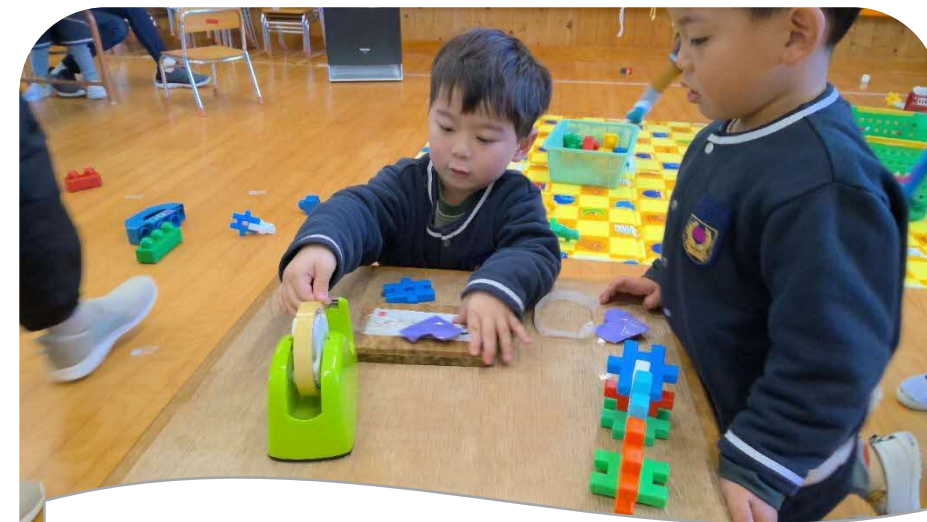
遊びながら、セロハンテープも上手に使えるようになりました