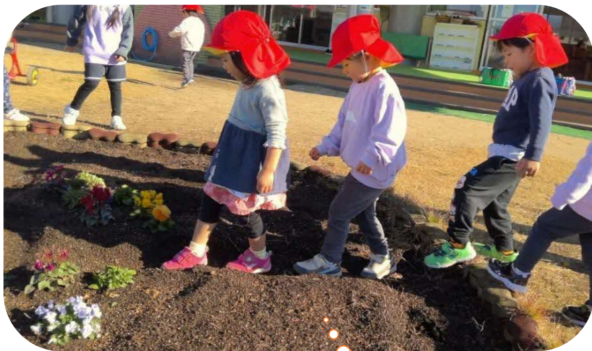
花壇の中にフシギ発見！探検してみよう！