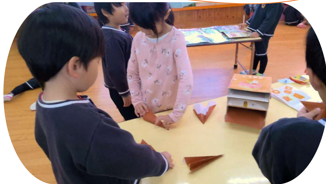
折り方を教えあいながら飛行機づくり