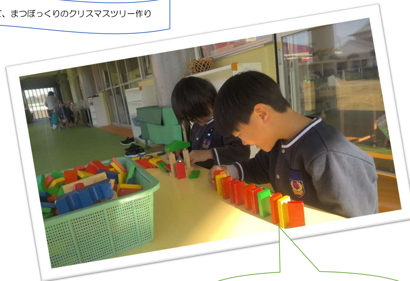
一緒に作るってたのしいね！