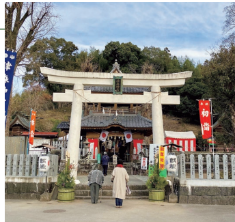
『初雪』 清水宏さん 撮影場所：惣領