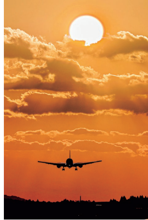
『夕陽と飛行機』 松下正吾さん 撮影場所：阿蘇くまモン空港