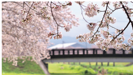
『満開の桜』川端あすかさん 撮影場所：秋津川河川公園

投稿は①氏名 ②住所 ③撮影場所 ④作品名を明記し mashikiphoto@gmail.com へ送信してください