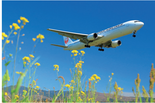
『菜の花のお出迎え』