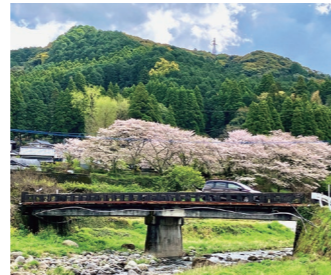
『里の橋』林田豊さん 撮影場所：下陳