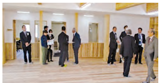
学びと支え合いの複合施設内