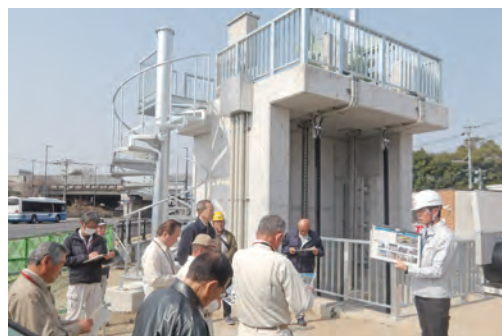
妙見雨水ポンプ場

さらに、補償補填及 び賠償金について、単 独費内訳の質疑があり、 都市計画決定した区域