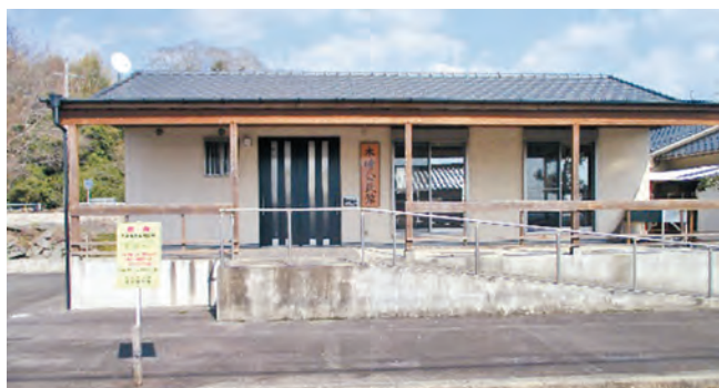
公益のために直接専用する公民館

公民館や消防施設などの公益等のために直接専用する固定資産税について、これまでの固定資産税減免措置ではなく、課税免除の取り扱いとする。