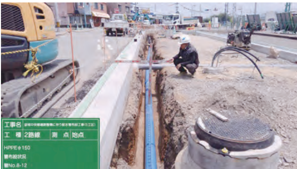
県道熊本高森線配水管布設工事