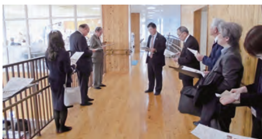
左奥が健康づくりルーム

ネットと町社会福祉協議会事務所を併設した複合施設との説明を受けた。また、町保健福祉セ