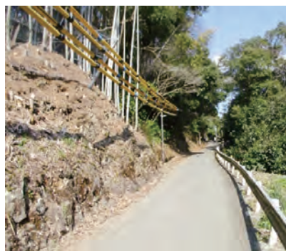
(第3期) 工事予定場所