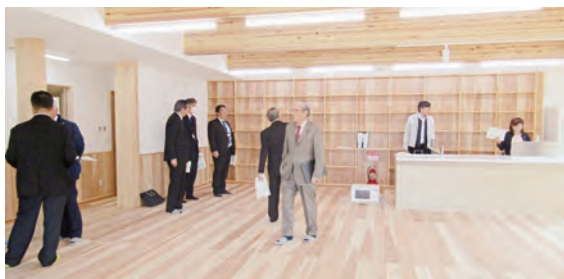
複合施設内フリースペース

ザー業務委託料等の随 意契約の妥当性につい て質疑があり、専門性 や継続性の観点から随 意契約としているとの 説明を受けたが、委員 から、業務マニュアル の整備等により競争性 を確保すべきとの意見 が出された。