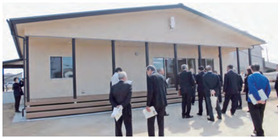
学びと支え合いの複合施設