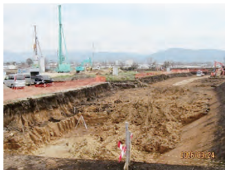
造成工事が進む産業団地

前年度予算との比較概要 令和7年度予算と対比して見ると、歳入では、町税や地方交付税が増加し、町債等への依存度が減少している。 歳出では、民生費や商工費が増加し、教育費と土木費等が減少している。