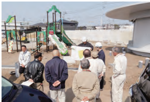
中央公園整備工事現場

また、負担金補助及 び交付金の新規就農者 経営発展支援事業補助 金にかかる就農形態及 び作付けについて質疑 があり、申請者は、 親元就農の方が多 く、その作付作物 は親と変わらない ことが多いとの説 明を受けた。 また、橋梁調査 業務委託料につい て、町内の橋梁数、 調査件数及び調査 法について質疑が あり、町内には 122の橋梁があ